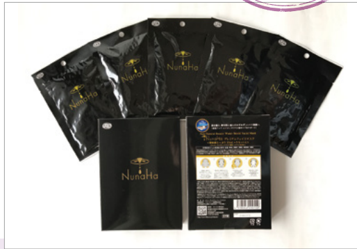
33ml(1袋)×5セット入(1 セットに顔用シート+首筋 用シート各1枚) もちろんサロン専売品だ。

美肌集中ケアアイテムとして人気のシートマスク。そのなかでも今、高い保湿力を持つといわれるジュンサイエキスを配合した『NunaHaプレミアムフェイスマスク』に熱い視線が注がれている。天然成分が生み出す、その“美肌力”に迫る。